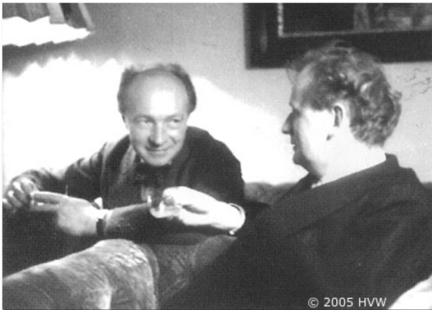
Ernst Wiechert (links) mit dem Pianisten Wilhelm Kempff

Wiechert konnte in den drei Jahren in Ambach einen größeren Freundeskreis aufbauen, dem auch der Schriftsteller Waldemar Bonsels und der Pianist Wilhelm Kempff angehörten. 1936 dann zog sich der „König der Stillen“, wie Kempff ihn später einmal nannte, in die Abgeschiedenheit des Gagert-Hofs zurück.