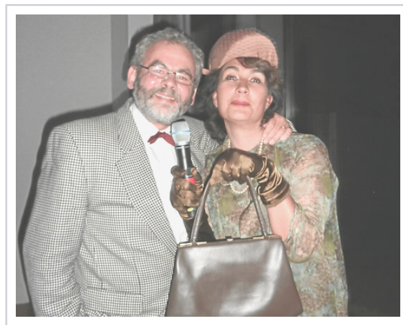
Auch Historiker und Vereinsvorsitzende können schauspielern und Menschen zum Lachen bringen.