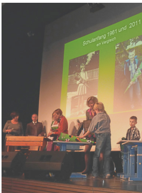
Schulanfang wie vor 50 Jahren