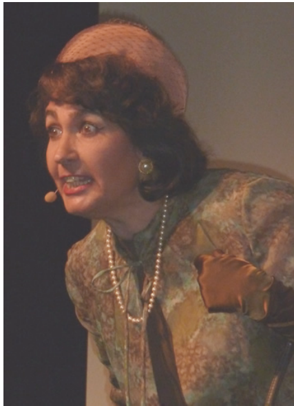
Alles "toll" und "beautiful" in "Wonderful Wolfratshausen"