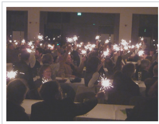
Wunderkerzen für SolLunas (und Elvis'!) "Can't Help Falling in Love"