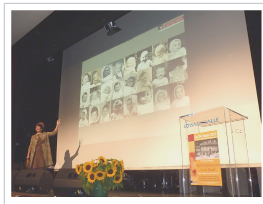
Einige der Wolfratshauer des Jahres 1961